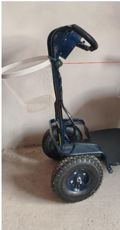
Palanca de regulacion de distancia de manubrio