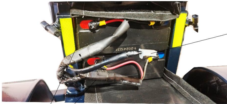
FICHA DE CONEXION DE CARGADOR